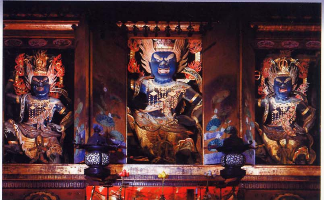
蔵王堂ご本尊、日本最大の秘仏 金剛蔵王大権現3体(重要文化財)