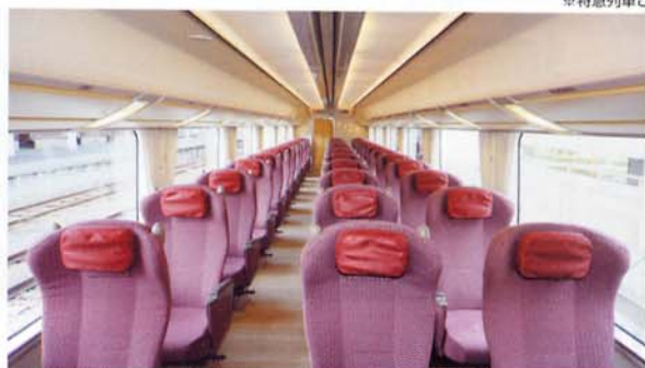
デラックスカー ※デラックスカーのご利用は、別途特別車両料が必要となります。